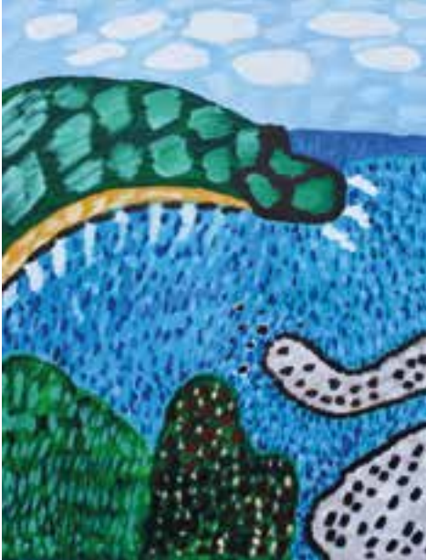
AF LONE GRAVERSEN