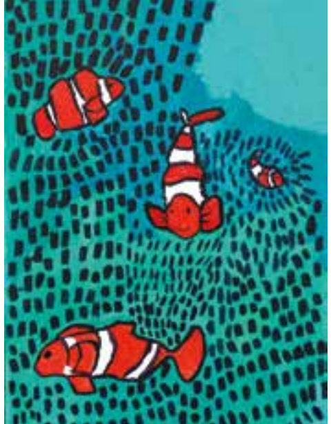
AF KIRA HUNNICKE